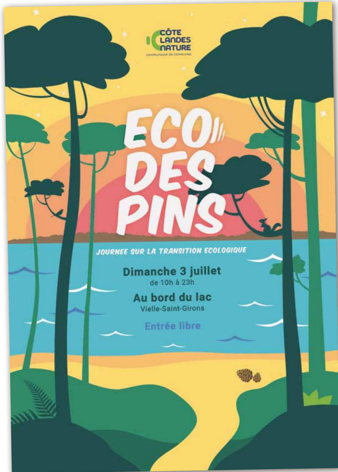
Un évènement au Lac de Vielle nommé "L'ECO DES PINS"

Une journée sur la transition écologique est organisée par la Communauté de Communes Côte Landes Nature le dimanche 3 juillet, à partir de 10 h 00, au lac de Vielle-Saint-Girons . Baptisé l'Eco des Pins, cet évènement se veut festif, convivial, familial, et, bien sûr, écoresponsable. Au programme : des animations et jeux pour les petits et les grands, des expositions, un éco-village, des concerts, du théâtre de rue et de quoi se restaurer le midi et le soir. Véritable temps de partage intergénérationnel, cette journée est également l'occasion de valoriser les acteurs du territoire engagés dans une démarche durable.